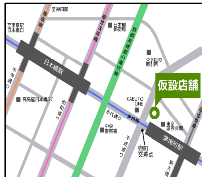
地下鉄茅場町駅徒歩約1分 地下鉄日本橋駅徒歩約5分

【名称】 宮城ふるさとプラザ (現在と同じ店名で営業いたします) 【住所】 〒103-0025 東京都中央区日本橋茅場町1丁目6-17 十字屋ビル1階 ※正式な開店日・電話番号、営業時間は未定 【設置・運営】 公益社団法人宮城県物産振興協会