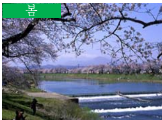
봄 벚꽃과 자오 (오가와라마치)