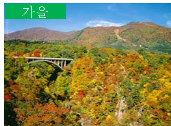
가을 나루코요 (오사키시)