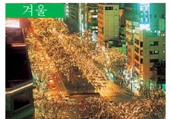
겨울 빛의 페이전트 (센다이시)