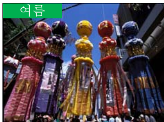
여름 센다이 다나바타 (센다이시)