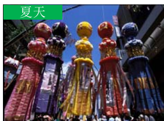
夏天 仙台七夕節 (仙台市)