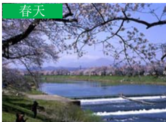
春天 櫻花與藏王山脈 (大河原町)