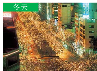
冬天 仙台“光的盛典” (仙台市)