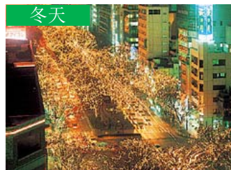
冬天 仙台“光的盛典” (仙台市)