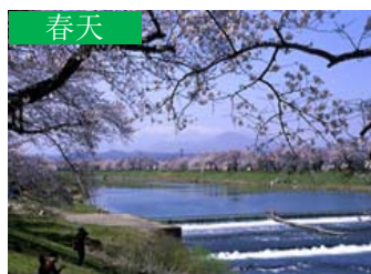
春天 櫻花與藏王山脈 (大河原町)