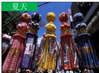
夏天 仙台七夕節 (仙台市)