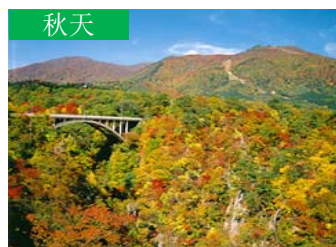
秋天 鳴子峽 (大崎市)